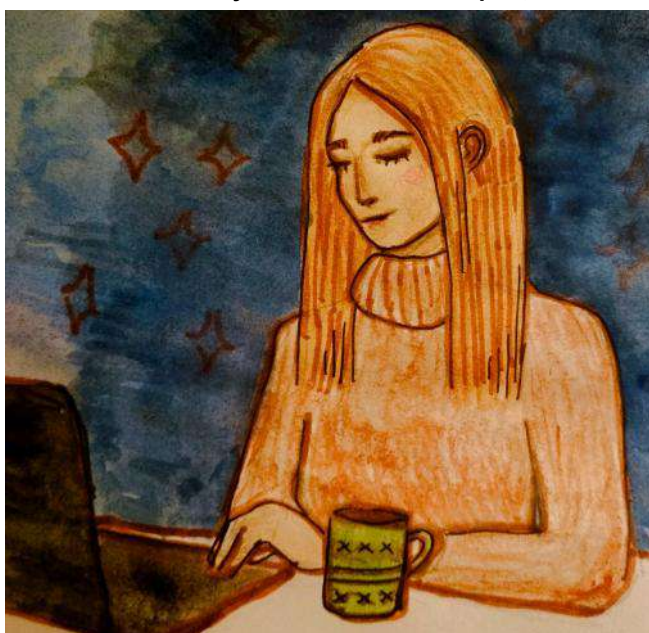
Рисунок Платоновой Марии, 10Б класс