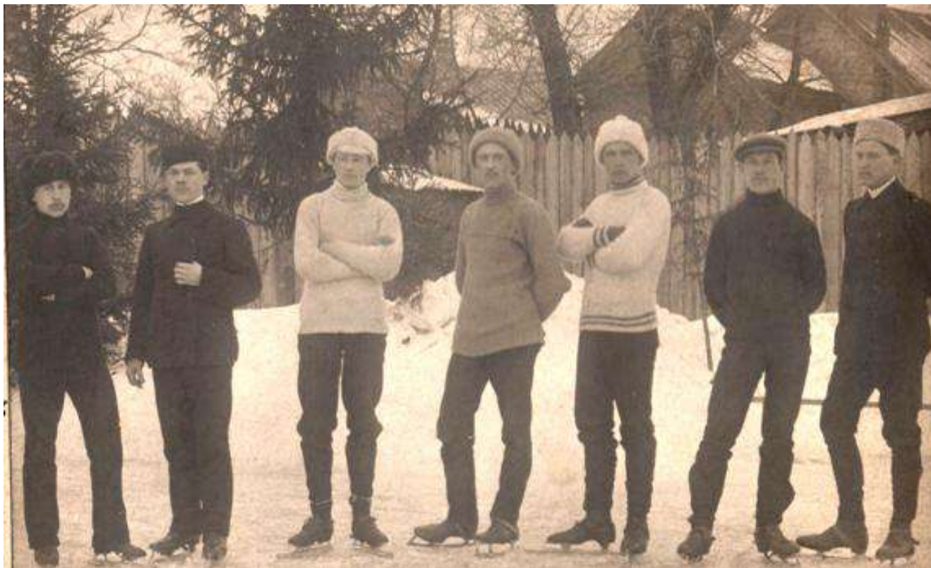
Участники пробега Городец - Нижний Новгород - Городец. 1914 год.

тами и пр. и пр. Все это судит, рядит, делает свои замечания».