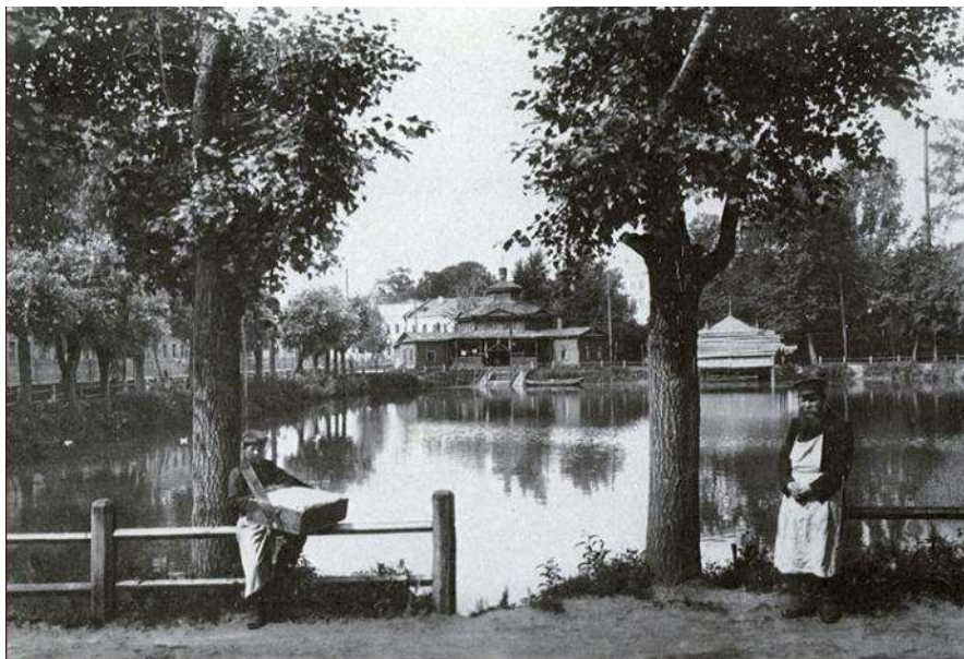
Нижний Новгород. Черный пруд.