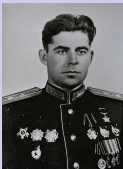
Береговой Георгий Тимофеевич

Б ереговой Г.Т. - двоюродный брат моей прабабушки, лётчик-космонавт. Он единственный дважды Герой Советского Союза, кто первую Золотую Звезду получил за Великую Отечественную войну, а вторую Золотую Звезду за полет в космос.